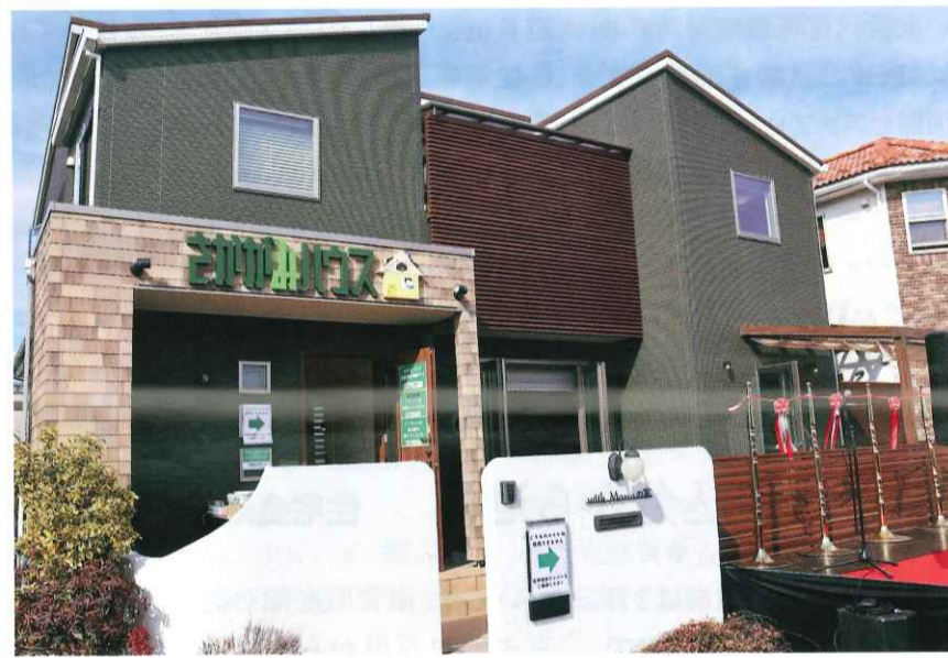
袖ケ浦市にオープンしたさかがみハウス